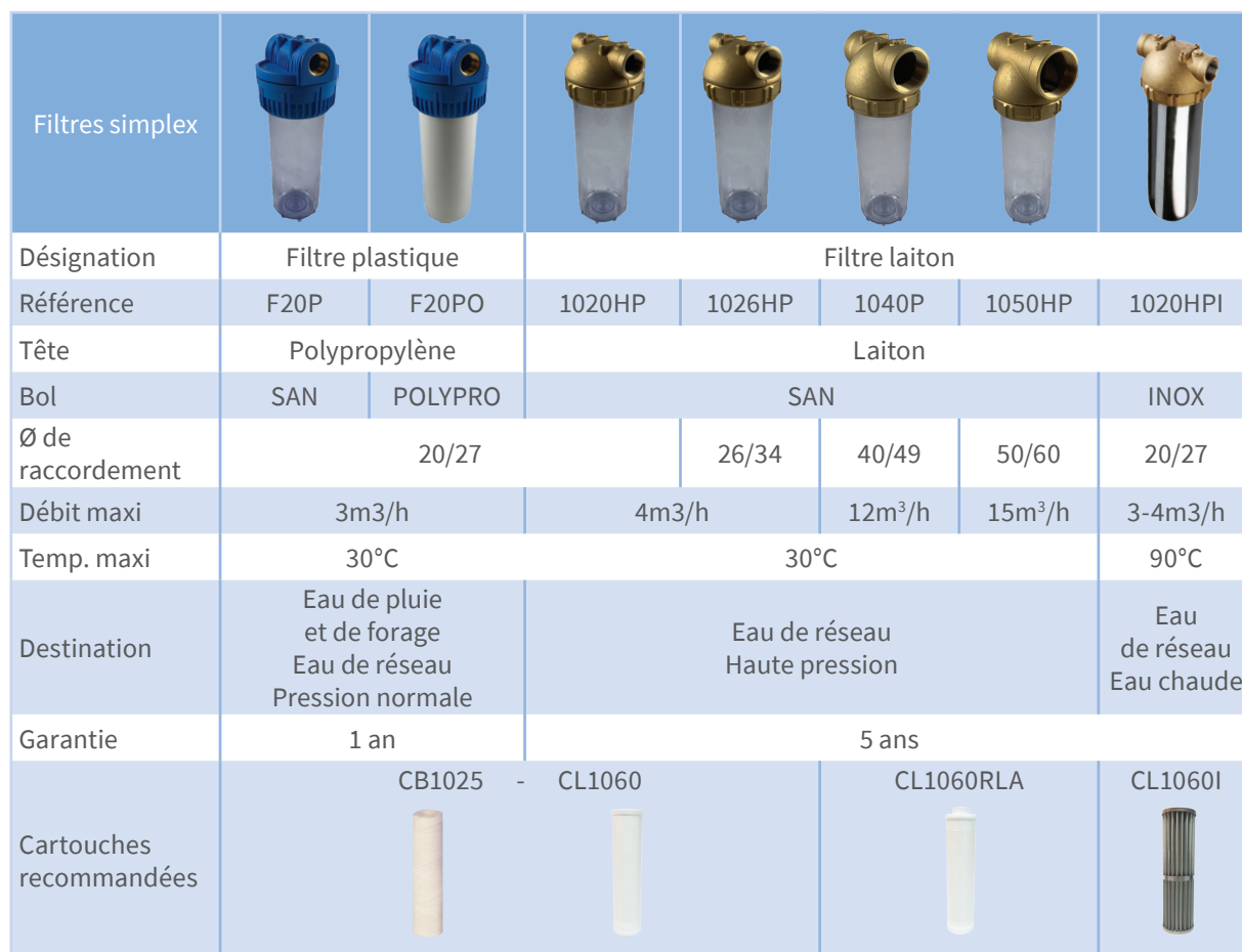
Tableau de sélection des filtres